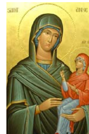
Die Heilige Anna