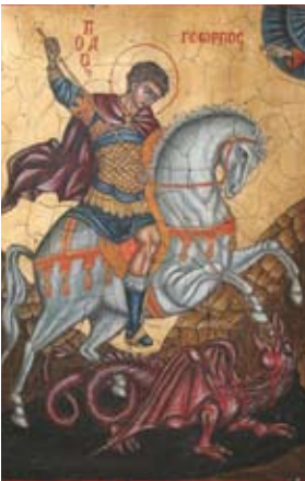
Der Heilige Georg