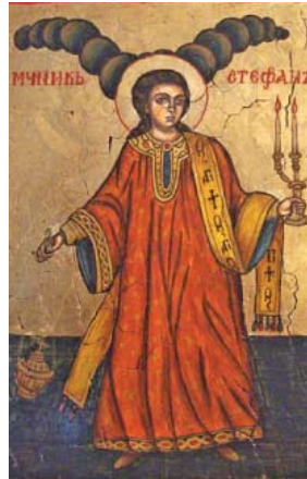
Der Heilige Stephan