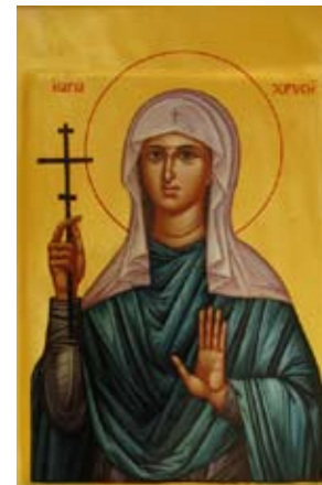
Die Heilige Christine