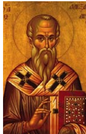
Der Heilige Alexander