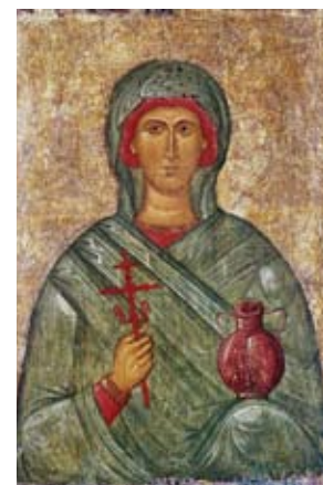
Die Heilige Katharina